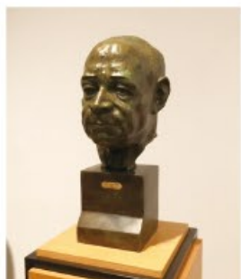
梅原龍三郎(うめはらりゅうざぶろう)