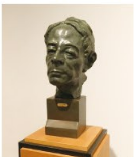
萩原朔太郎(はぎわらさくたろう)