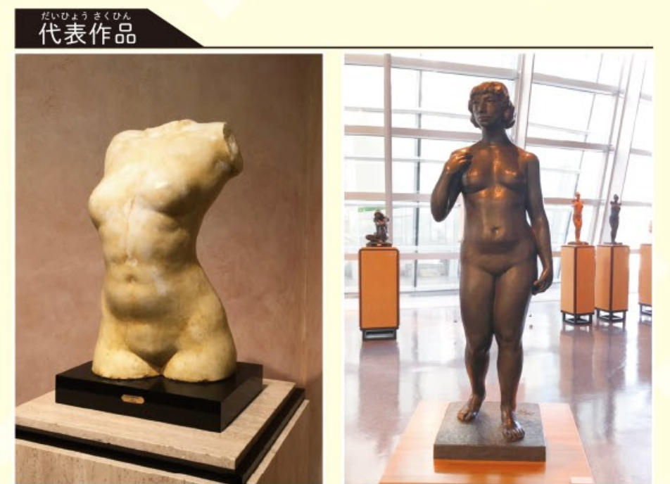
「カテドラル」セメント・1937年 「遠望(えんぼう)」ブロンズ・1981年