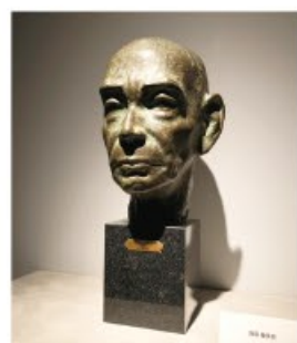
西田幾多郎(にしだきたろう)