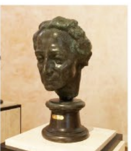
イザベル・ルオー