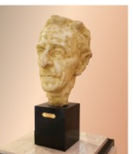
ジャン・コクトー